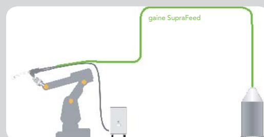
du fût au moteur avant