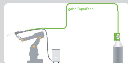
du dévidoir au moteur avant