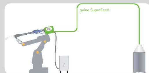
du fût au dévidoir